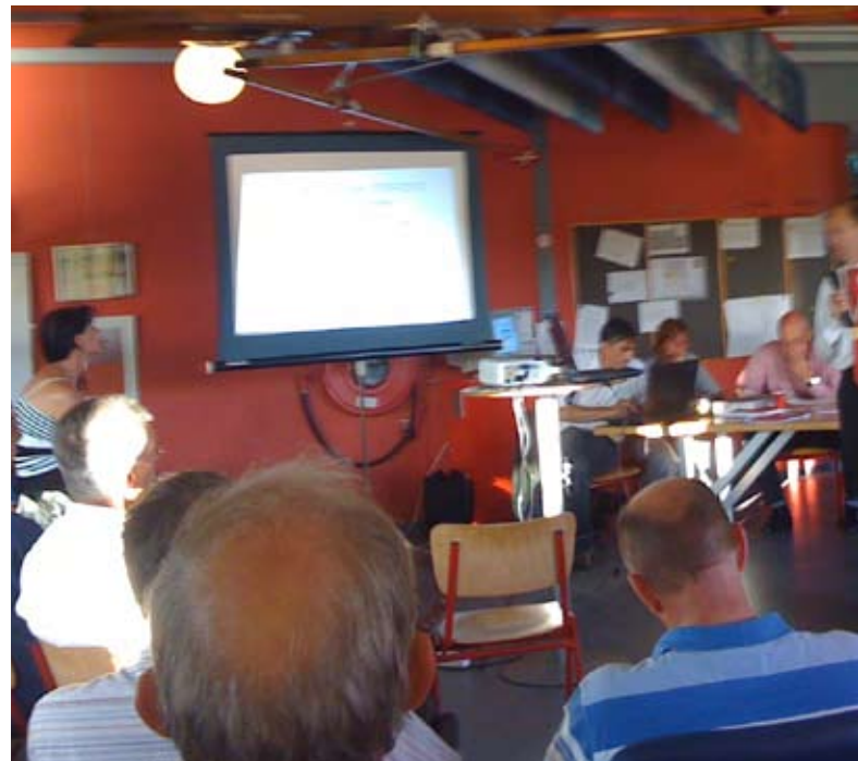
volle bak bij de ledenvergadering