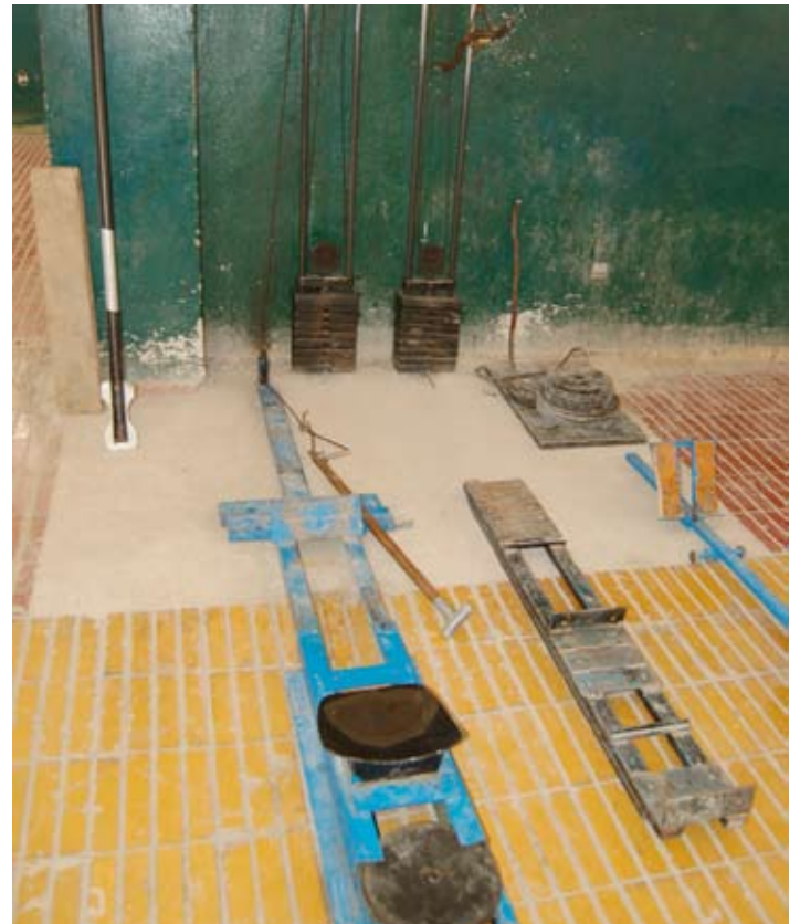
Een soort van ergometer

De inrichting van de fitnessruimte is niet te evenaren. Er staat een grote waterbak (met ongetwijfeld blauwalg, bilharzia en onchocerciasis) waar sinds 1984 volgens mij niets meer mee gedaan is. Verder liggen er her en der stapels gewichten die op zeer bijzondere wijze tot de meest creatieve halters en andere fitnessapparatuur zijn vervaardigd. De ergometer bestaat uit twee staven op de grond (=rails) met daarop een zitting van een stoeltje. Aan een steel (met horizontaal latje) was een ijzerdraad gebonden dat vervolgens aan de gewichten was vast gemaakt. Door aan de steel te trekken, werden de gewichten omhoog getrokken, in de 'recover' gleden ze weer richting de grond. Prima constructie, kun je heel sterk van worden.